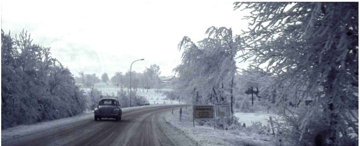
In der Schlad im Winter 1969